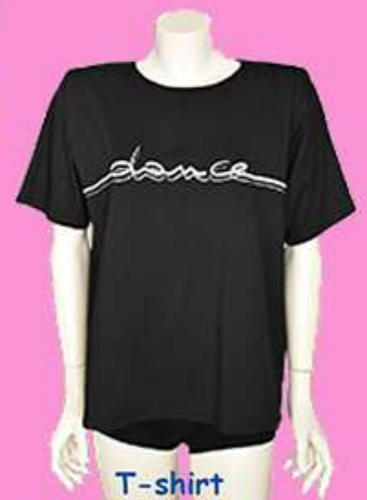
T-shirt con spalline imbottite + € 1,50