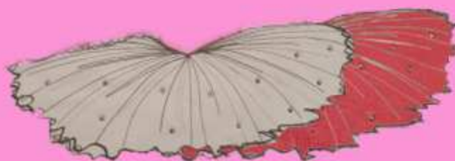
Dettaglio: sul tutù vi sono applicati strass ss10.